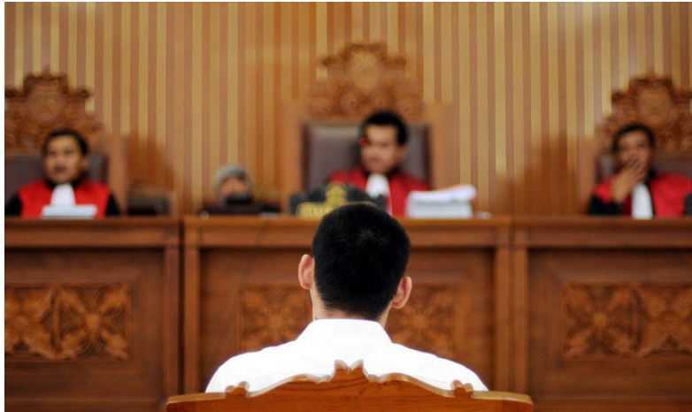
Gambar 1. Persidangan