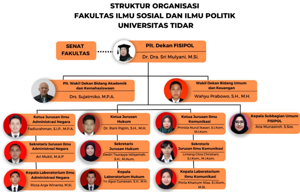
Gambar 1. Struktur Organisasi FISIPOL

Tugas Pokok dalam struktur organisasi FISIPOL adalah sebagai berikut: